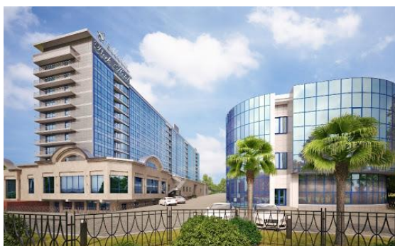
Отель «Маринс Пар» и Корпус «Конгресс-центр»