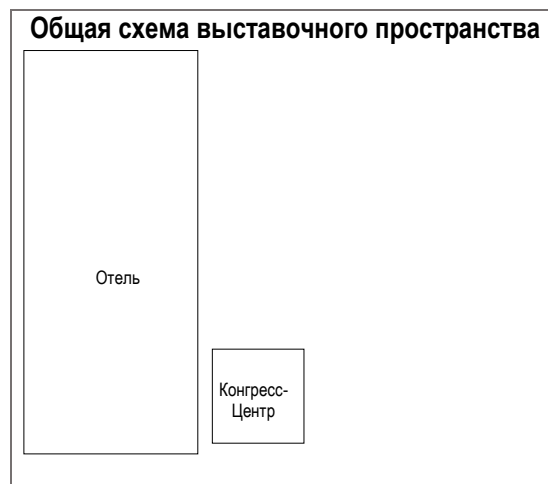
Схема ярмарки контактов в зале Екатеринбург 16 и 18 октября